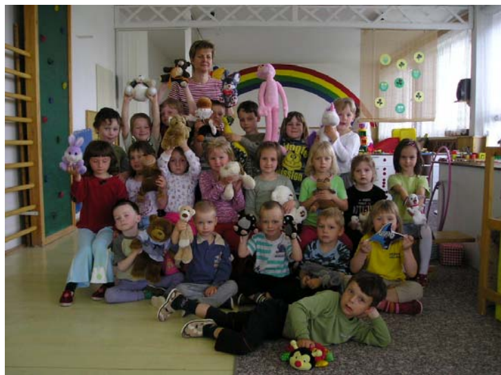
Další fotky v MŠ.

Oba byli skoro stejně velcí, měřili asi 120 cm. Nejmenší plyšák pak měřil 7 cm. Plyšákový den se nám všem moc líbil.